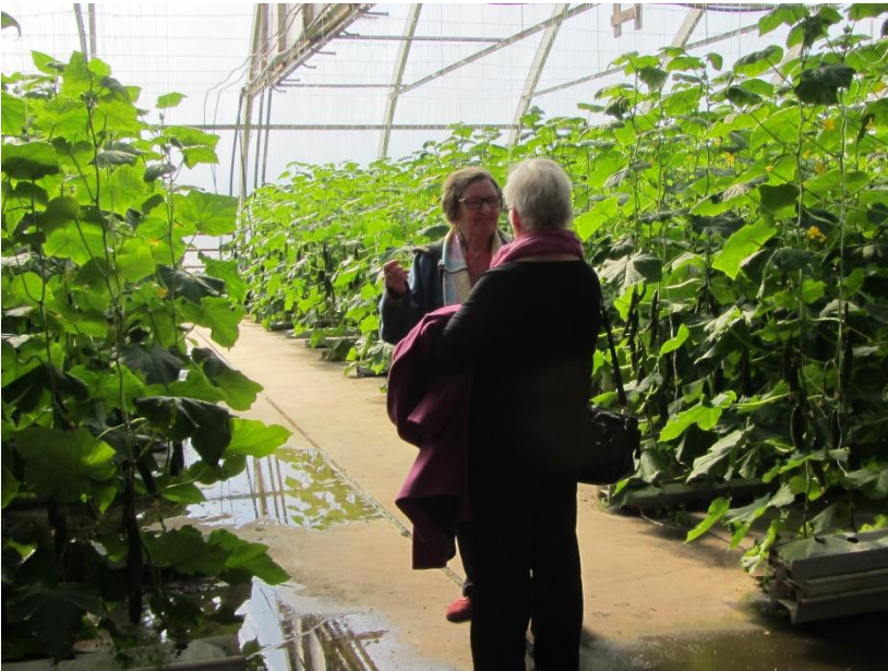
Pitkät olivat kurkkurivit.