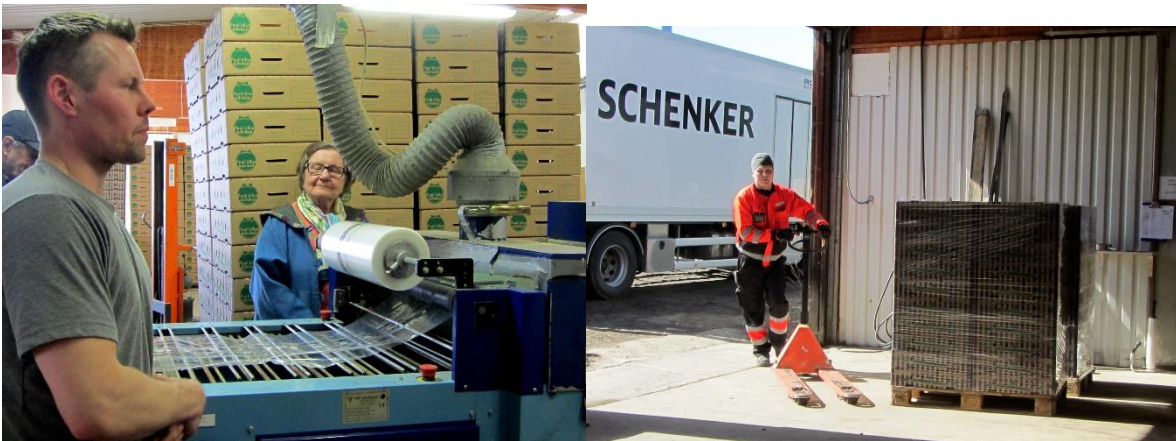
Lopuksi kurkut kääritään muoviin ja ne lähtevät kuluttajille