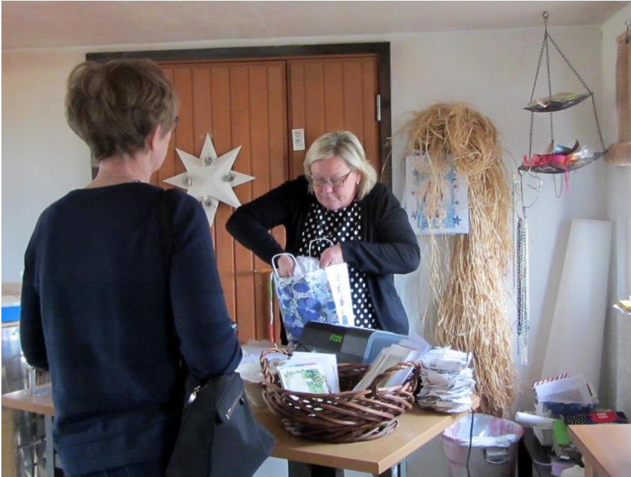
Löytyihän sieltä kassiin pantavaakin esim. ylioppilaslahjaksi.