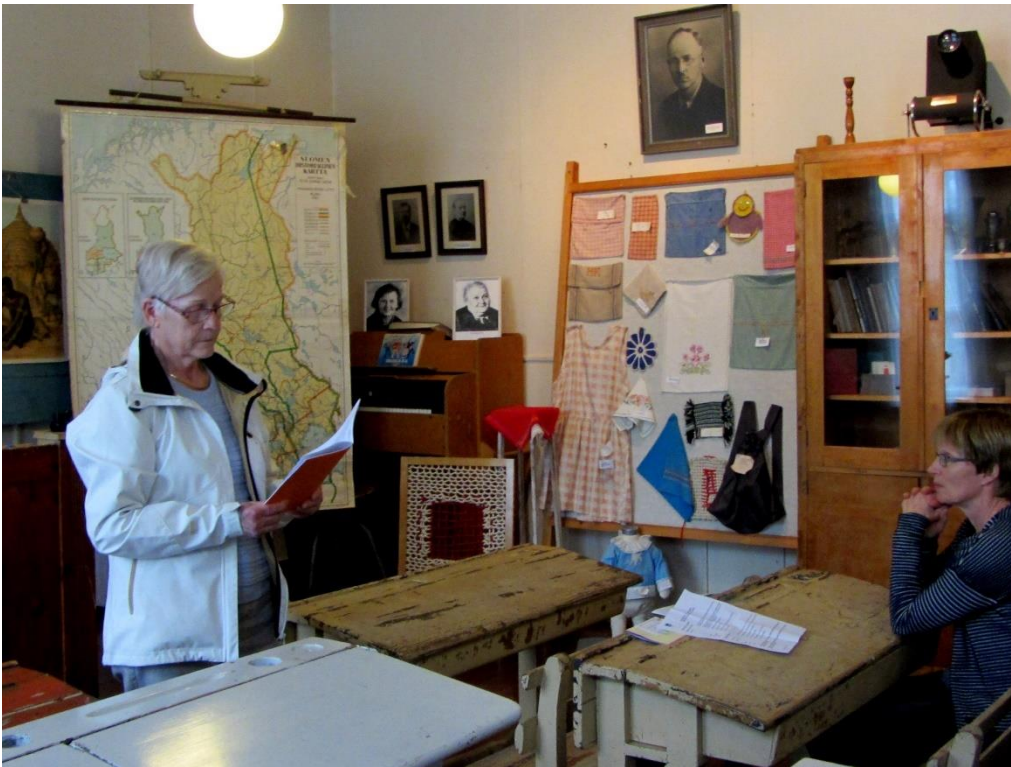
Salme kertoi vuosikokouskuulumisia Helsingistä