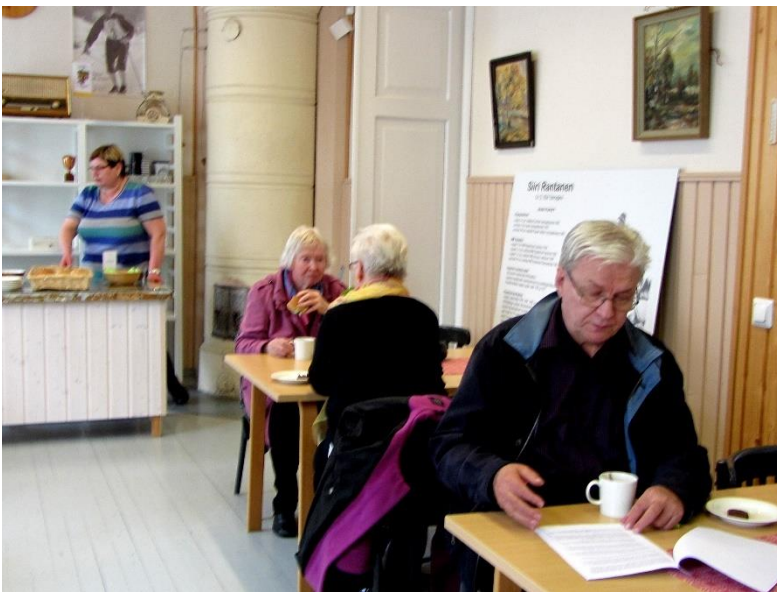
Kahvi ja tuoreet sämpylät maistuivat