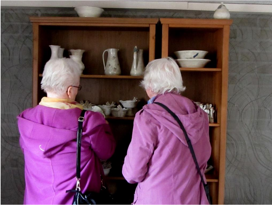
Kauniita savitöitä, joissa usein oli enkeli, oli mukava katsella.