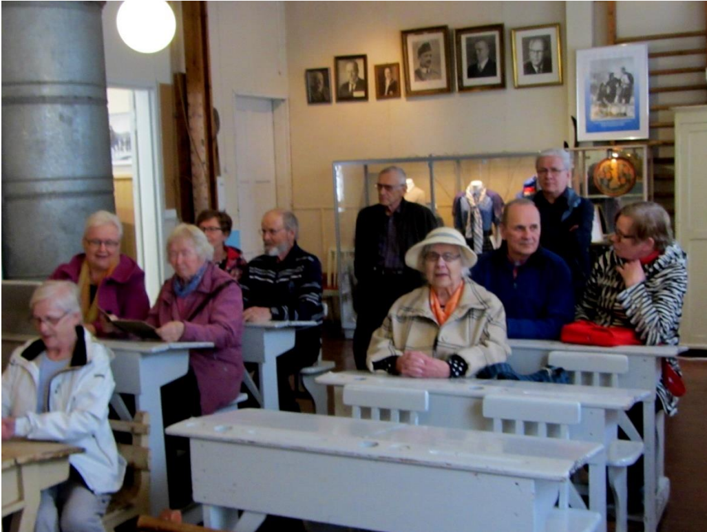
Koulumuseossa istahdimme meille kansakoulussa tuttuihin pulpetteihin